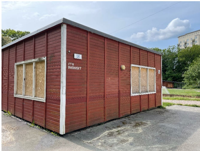
Den tomställda förskolan.